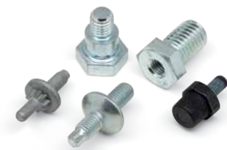
Verbindungselemente nach Zeichnung

optimieren Sie Ihr C-Teile-Management mit lieferantengebundenen Artikeln.