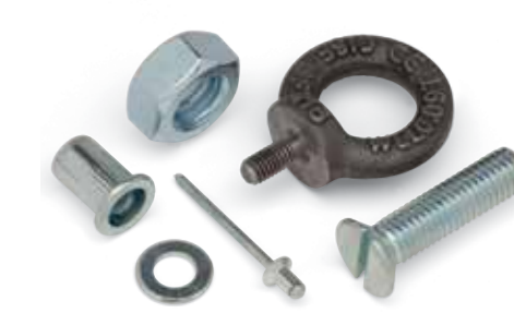
Verbindungselemente, Niettechnik und Dübel

Starten Sie mit unserem Kern-Sortiment, integrieren Sie Sonderteile und