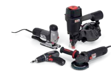
Elektro- und Druckluftwerkzeuge