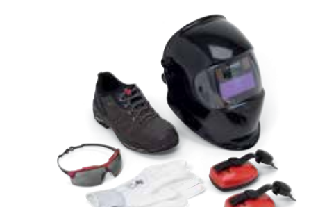
Sicht- und Gehörschutz