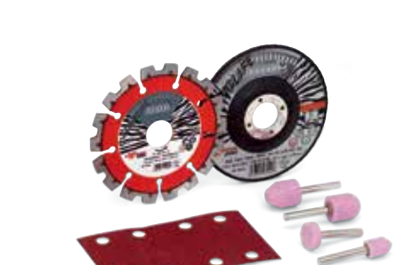
Schneid- und Schleifmittel