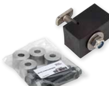
Sortimente und Baugruppen