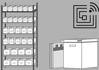
Kanban-Systeme für Ihre Produktionsmaterialien

Endlich Produktivität im C-Teile-Management: Es ist Zeit anzupacken! Beginnen Sie jetzt!