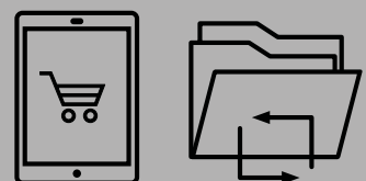
E-Business Lösungen für alle Materialien